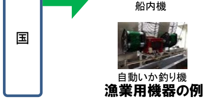
自動いか釣り機 漁業用機器の例