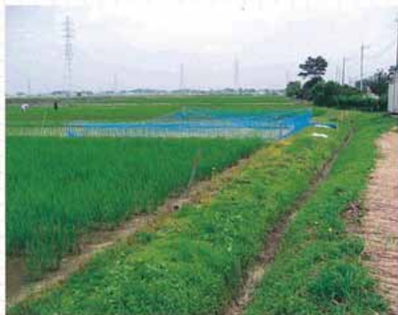
鳥除けの例 (青く見えるのが防鳥ネット)

田植えが終わり、産卵期になったら、排水口近くの水深が深い場所の上空に、網をかけたリ糸を張って、下の写真のように鳥除けを作ります。