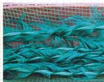
人工産卵藻(きんらん)