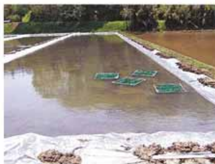
ビニールシートを使用した休耕田の漏水対策 (浮いているのは人工産卵藻)