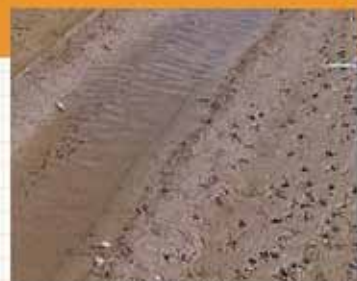
魚を食べに田んぼに来た鳥の足跡