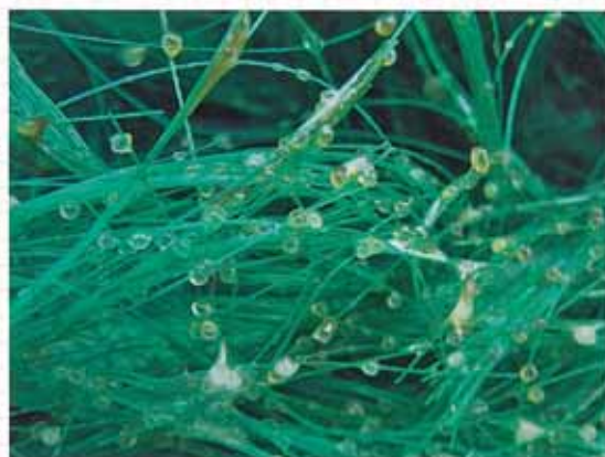
人工産卵藻に産み付けられたフナの卵

稲の根元にも卵を産み付けることがあります。そのような場合は、翌年からは水草などを入れる必要はありません。よく観察してみましょう。