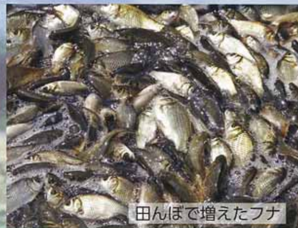
田んぼで増えたフナ