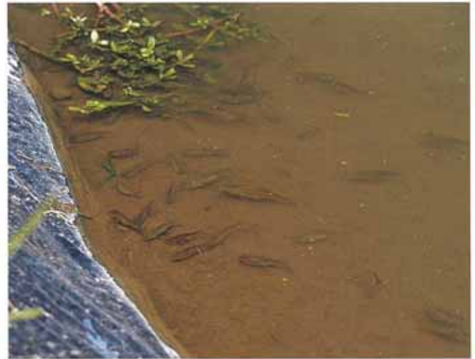
田んぼで増えて泳ぐフナの稚魚