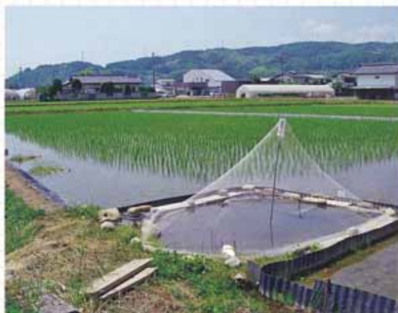
据え付け型の鳥除け産卵場の例

田植え後3週間もすると、成長した稲が魚の隠れ場になります。その頃に親魚を放流する場合は、鳥除けは不要です。