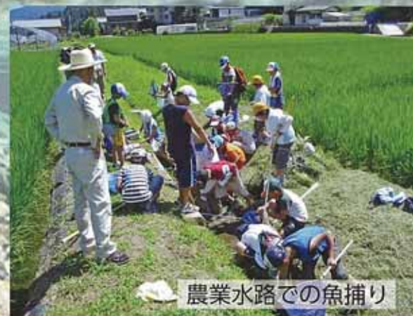
農業水路での魚釣り