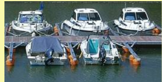
民間収益施設・ボートウォークイメージ