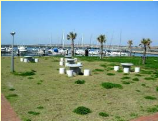
広場・緑地イメージ