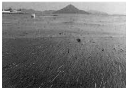
写真 16-1-3 アマモ場