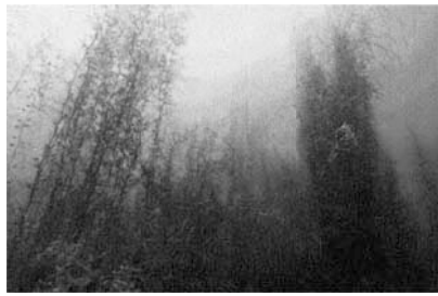
写真 16-1-2 ガラモ場