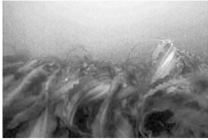
写真 16-1-1 コンブ場