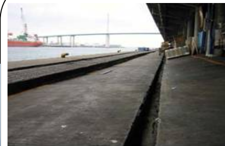
岸壁の舗装の陥没