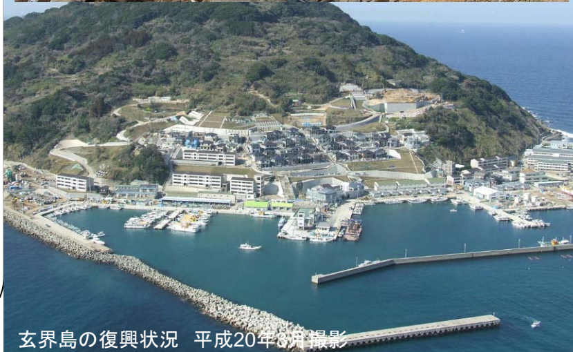
玄界島の復興状況 平成20年8月撮影