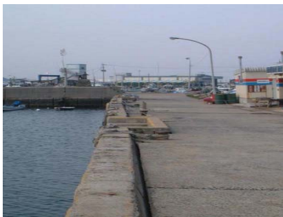
岸壁の舗装の陥没