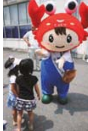
次期大会予定・鳥取県の大会マスコットにバトンタッチ