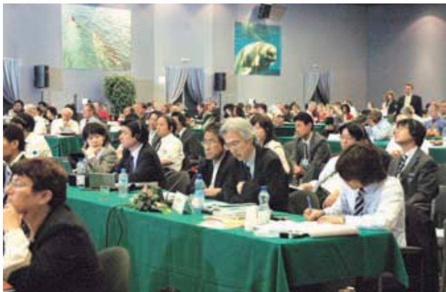
69カ国が参加したIWC年次会合の日本代表团 中央右から3人目が日本代表の 中前 IWC政府代表

平成22年6月21日(月)から6月25日(金)まで、アガディール（モロッコ）において開催されました第62回国際捕鯨委員会（IWC）年次会合の結果についてお知らせします。