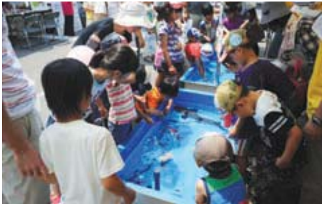
大会関連行事のタッチプールに興じる子どもたち