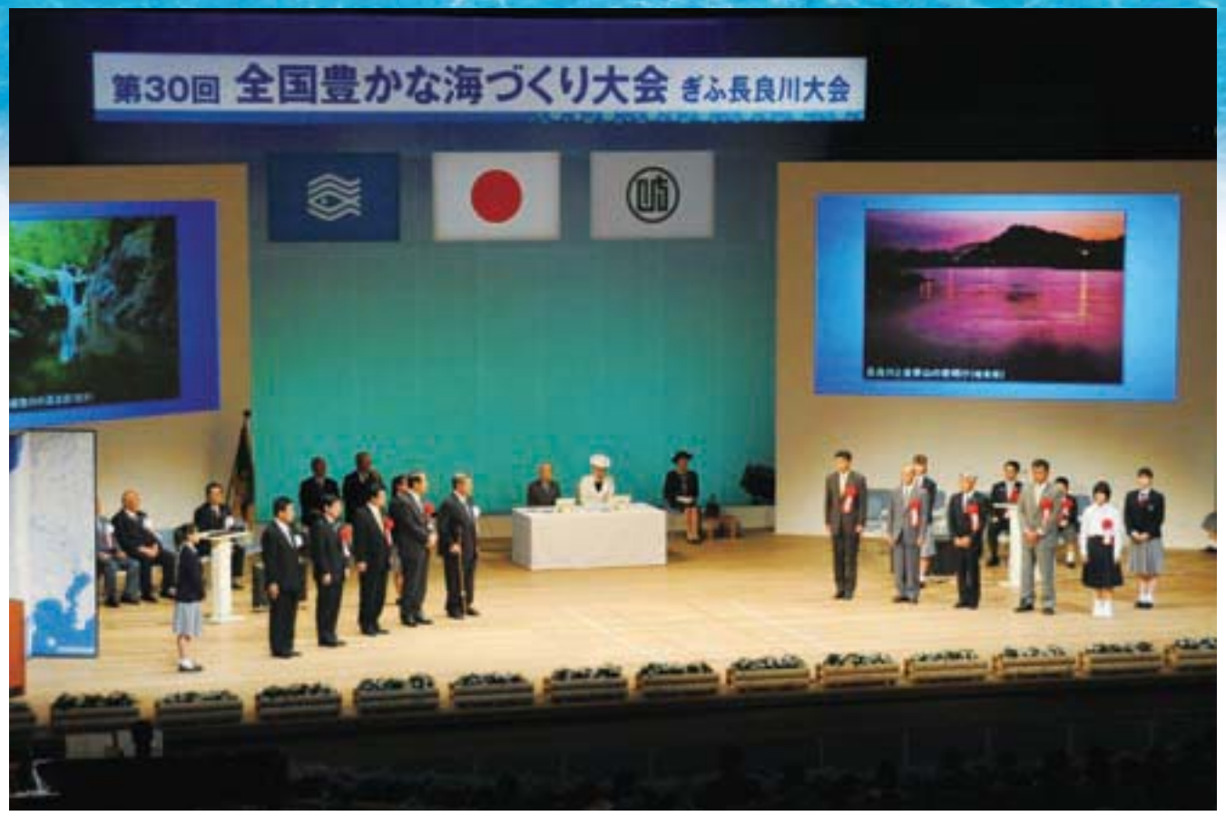
第30回全国豊かな海づくり大会 ぎふ長良川大会