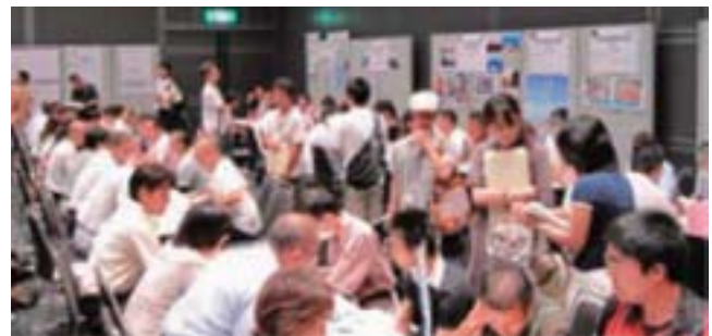
就業フェアの様子