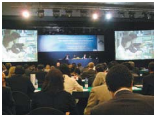
舟山政務官による日本のステートメント発表

我が国からは、科学に基づく議論を尊重すべき旨強調しつつ、全ての関係国が議長・副議長提案のアプローチにしたがってコンセンサス決定の実現に向け努力することを要請しました。他方、豪州、ラテンアメリカ諸国等は、事実上、同提案をベースに議論することを拒否しました。