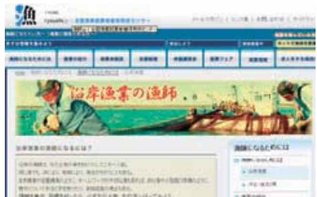
全国センターHPによる情報提供

平成21年度は、漁業就業支援フェアや長期研修等の参加者から、132名の新規就業者が生まれており、各地域の担い手として活躍しています。