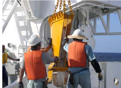
ドレッジ（底生生物の定量採取用）