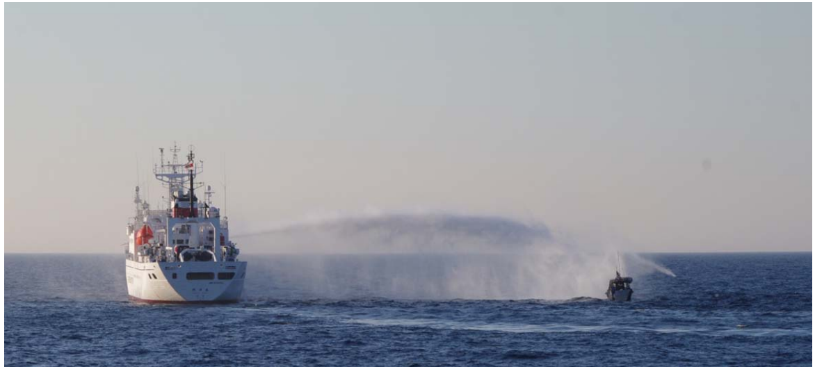
日本海大和堆周辺水域において北朝鮮漁船に対し放水する水産庁漁業取締船