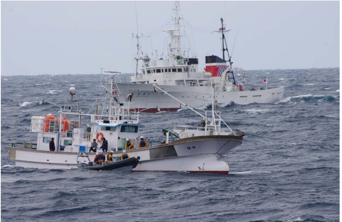
山陰沖で韓国漁船を拿捕する水産庁漁業取締船と漁業監督官