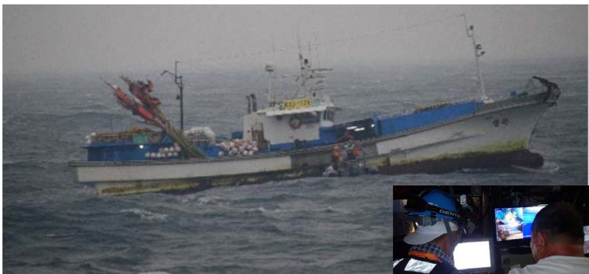
東シナ海で韓国漁船へ移乗する漁業監督官