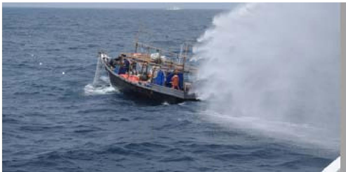
日本海大和堆周辺水域において北朝鮮漁船に放水対応