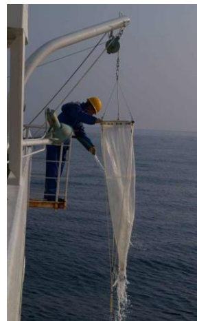
プランクトンネット （ノルパックネット（動物プランクトン））