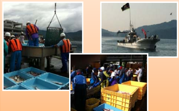
定置網漁の水揚げ(7月1日～)