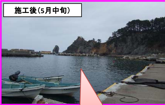
航路・泊地のがれきを撤去