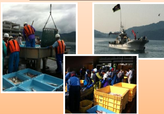
定置網漁の水揚げ(7月1日～)