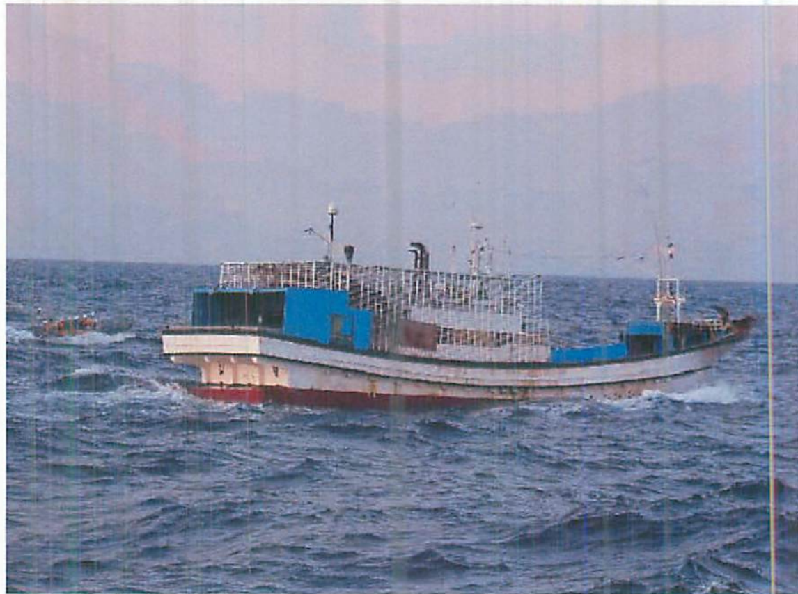
逃走する「305ギルリョン」を取締艇で追跡