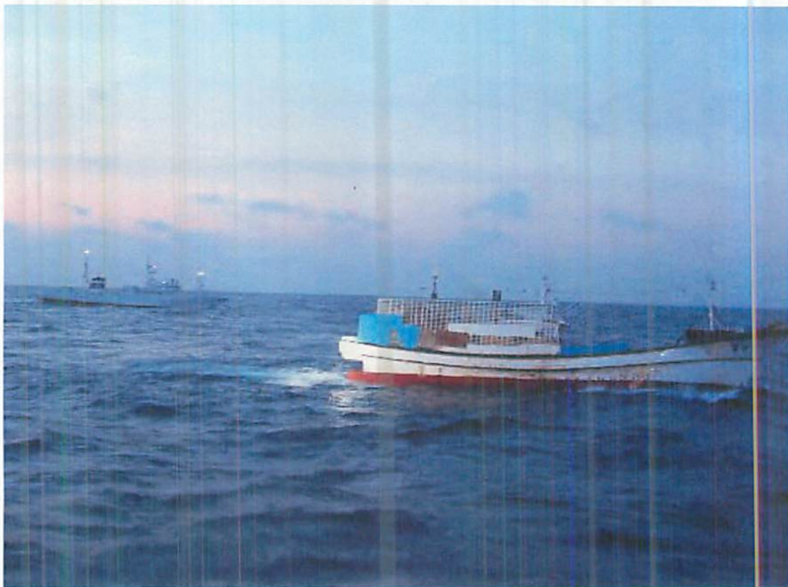
逃走する韓国アナゴ筒漁船「305ギルリョン」