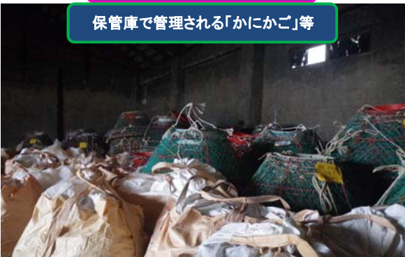
保管庫で管理される「かにかご」等