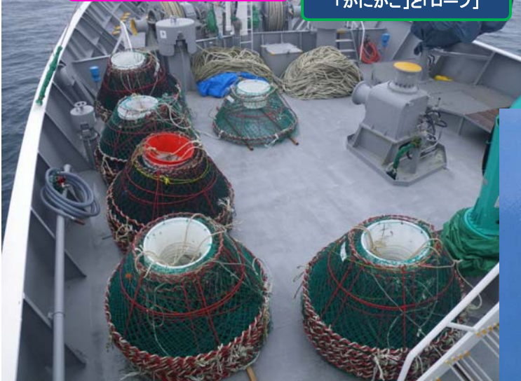
「かにかご」と「ロープ」