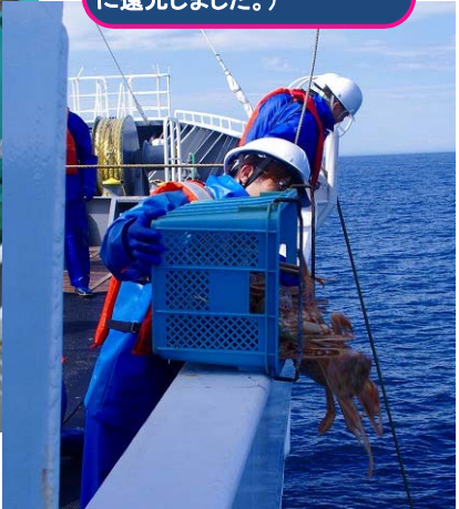
漁獲物 (押収した「かにかご」の中にはズワイガニが漁獲されていましたが、計量後すべて海中に還元しました。)