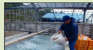
モズクの新規養殖