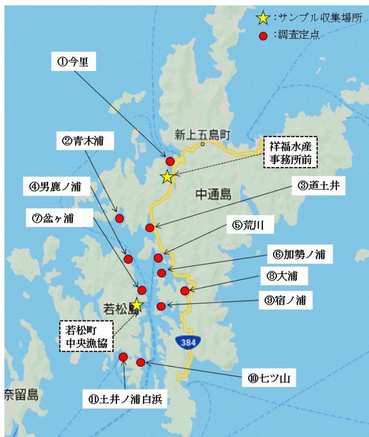
図1 調査定点および海水サンプル収集場所