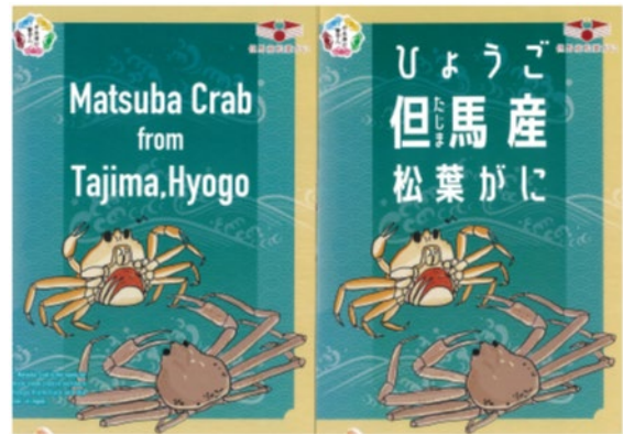
折込パンフレット