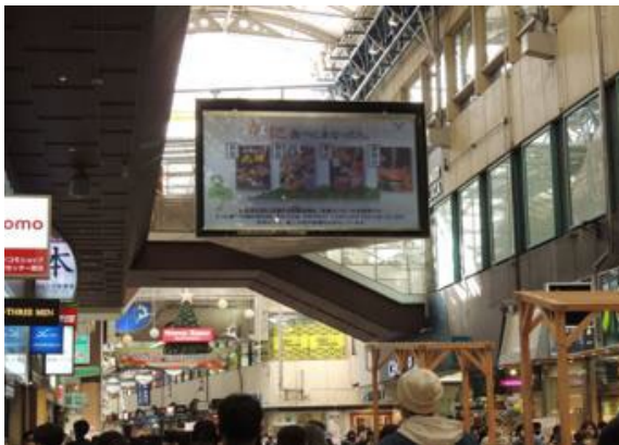
繁華街での大型スクリーン掲示