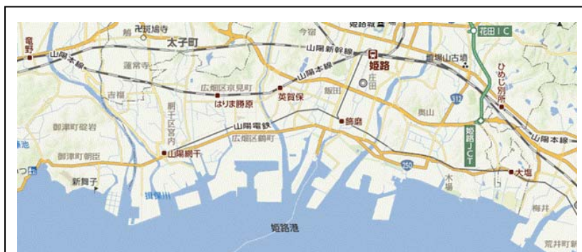
図 2 砂浜の海岸に面した地域

砂浜の海岸に面した地域(図 2)に住む漁業者は、観光客参加型の地びき網体験を実施し、地元水産物の宣伝と体験料金の収入による所得向上を図る。