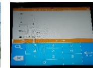
荷受け情報の電子化