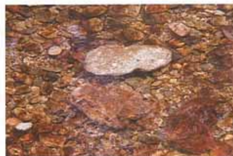
産卵された場所に置いた平らな石