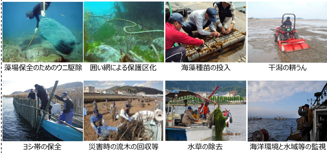
藻場保全のためのウニ駆除