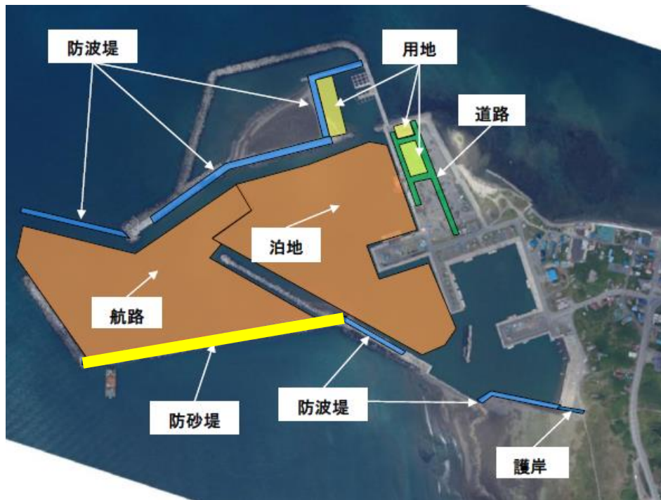
水産流通基盤整備事業 A地区 事業概要図(便益算定対象施設を黄で着色)