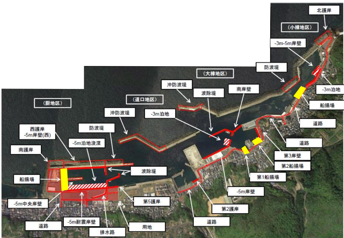
水産流通基盤整備事業 A地区 事業概要図(便益算定対象施設を黄で着色)