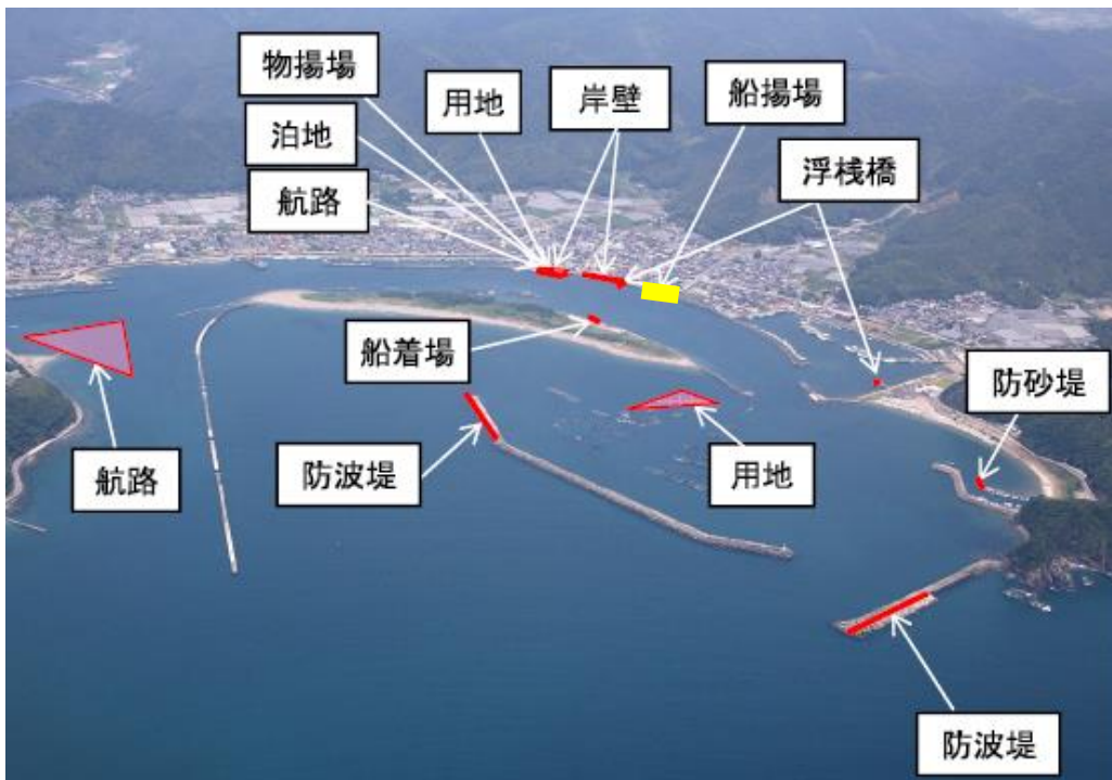
水産流通基盤整備事業 B地区 事業概要図(便益算定対象施設を黄で着色)