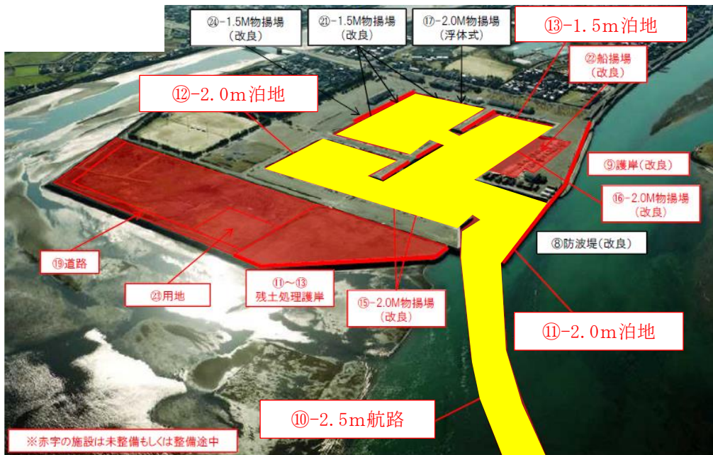
水産流通基盤整備事業 B地区 事業概要図(便益算定対象施設を黄で着色)