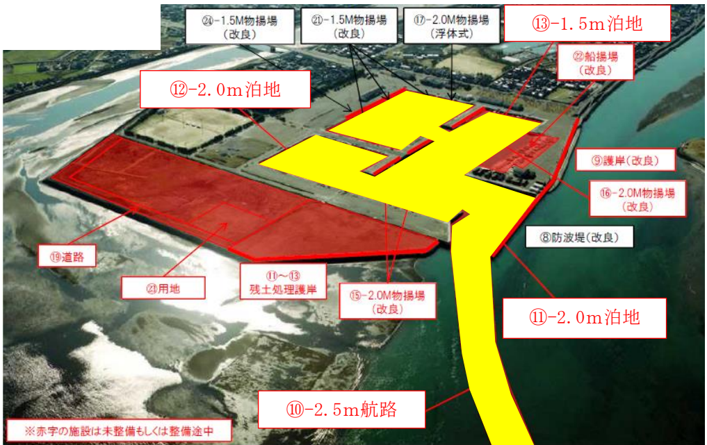
水産流通基盤整備事業 B地区 事業概要図(便益算定対象施設を黄で着色)

【整備前における課題】 B地区では、埋没により泊地・航路水深が浅いため船底が海底と接触し、漁船が損傷していた。 【施設整備により期待される効果】 泊地・航路整備後は、十分な航路水深が確保されることから、漁船修理費用が削減される。