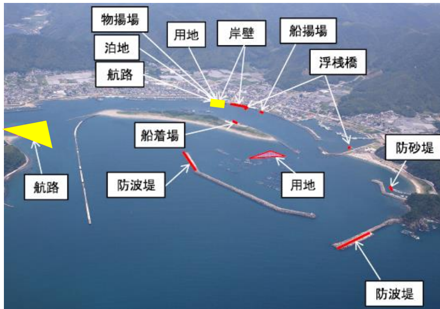
水産流通基盤整備事業 A地区 事業概要図(便益算定対象施設を黄で着色)