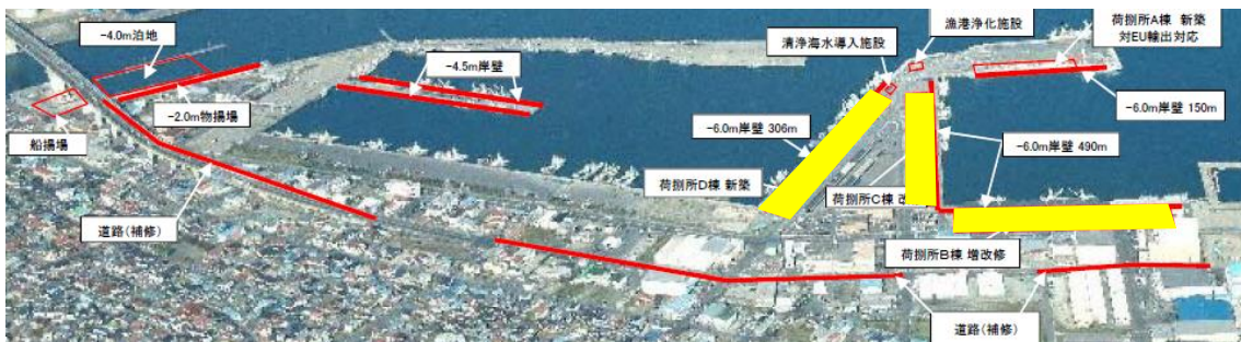
水産流通基盤整備事業 A地区 事業概要図(便益算定対象施設を黄で着色)