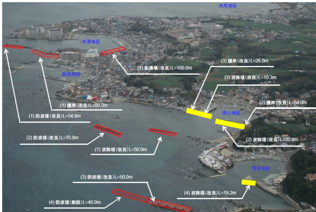
水産流通基盤整備事業 B地区 事業概要図(便益算定対象施設を黄で着色)