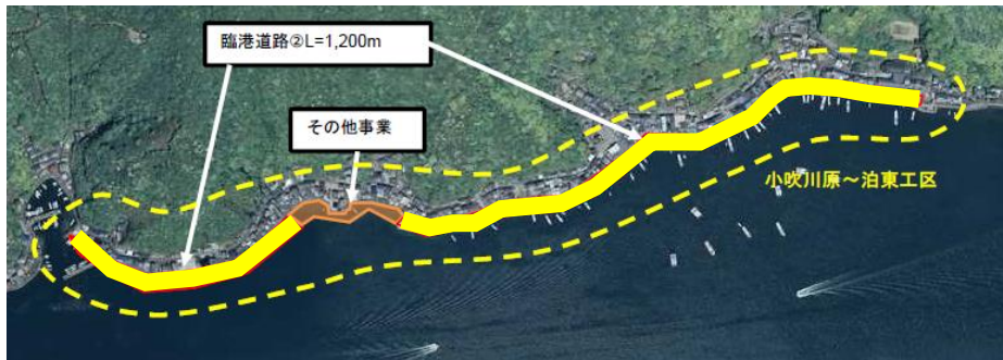
水産流通基盤整備事業 D地区 事業概要図(便益算定対象施設を黄で着色)