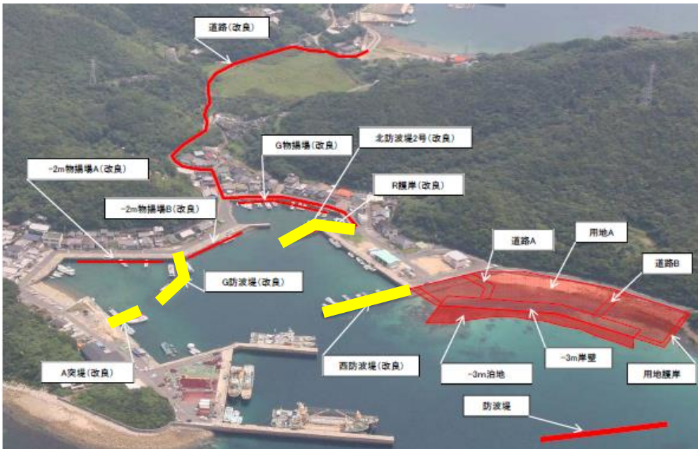
水産流通基盤整備事業 A地区 事業概要図(便益算定対象施設を黄で着色)