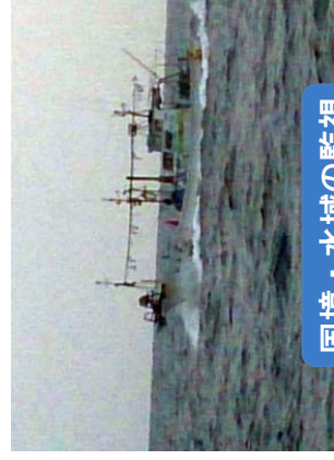
国境・水域の監視