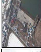
東日本大震災において漂流した漁船

○津波による漁船等の漂流物の流出や、漂流物による二次災害を回避するため、津波バリア施設を整備。