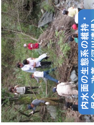
内水面の生態系の維持・保全・改善(河川清掃)