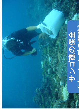
サンゴ礁の保全 (オニヒトデの駆除)