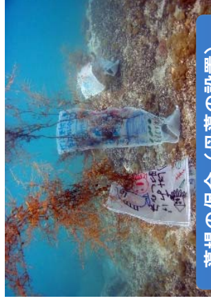
藻場の保全(母藻の設置)