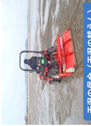
干潟の保全(干潟の耕うん)