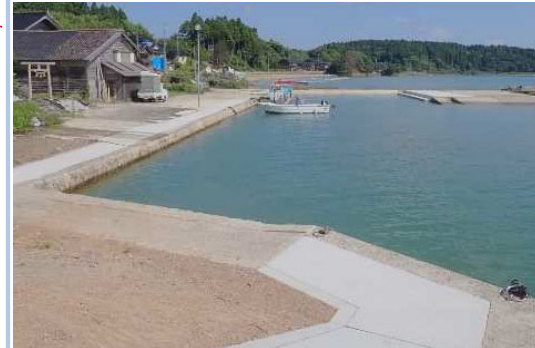
復旧が完了し、漁港内の全ての施設が利用可能となった。