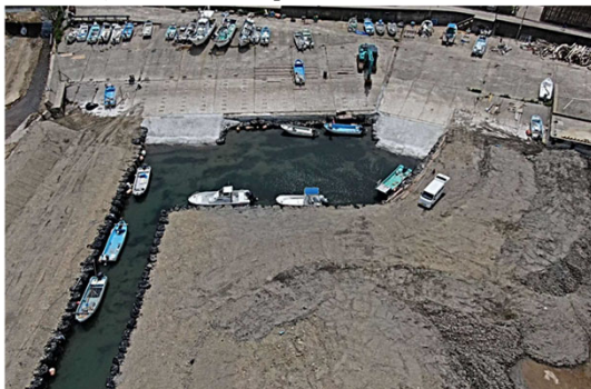
仮復旧事例：泊地の掘り込み、船揚場の前出しにより、陸揚げ作業が可能となった。