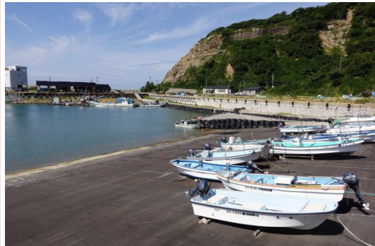
仮復旧事例：物揚場、船揚場の前出しにより、陸揚げ作業が可能となった。