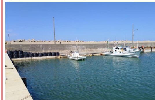
仮復旧事例：岸壁の切り下げを行い、陸揚げ作業が可能となった。