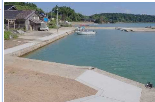
復旧が完了し、漁港内の全ての施設が利用可能となった。