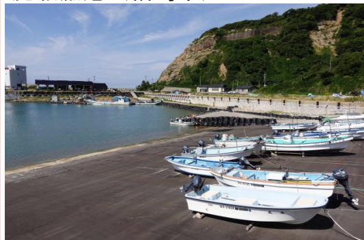
仮復旧事例：物揚場、船揚場の前出しにより、陸揚げ作業が可能となった。