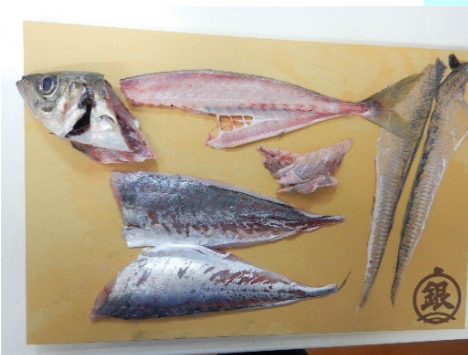
画像③丸魚を上手に食べて SDG s 1尾から1.5倍食べる方法