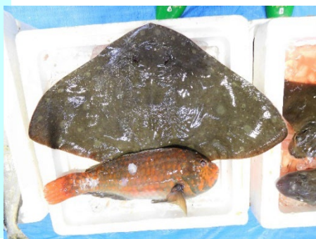
画像①未利用・低利用魚の 食べ方の情報発信

○さかなの日において量販店や小売店、学校給食などが・低利用魚の地魚を取扱う際への支援活動として、資料、動画、チラシ等を提供して、魚種の説明や魚の簡単なさばき方や食育プログラムの提供に取り組む。