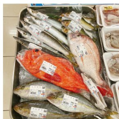
丸魚売り場でお魚を楽しくアピールしています