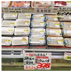
地元で採れたしらすも積極的に販売