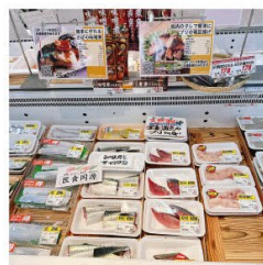
動画レシビのポップもつけています