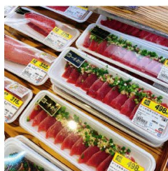
かつお刺身は現在ほぼ毎日販売