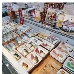
すぐ調理できる切り身の販売