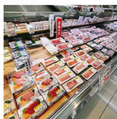
まぐろは力を入れています。