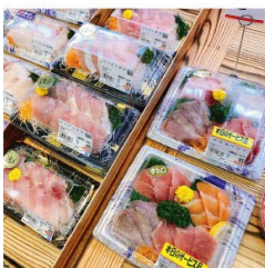
いろいろなお刺身盛り合わせを販売