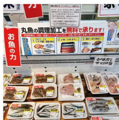
調理加工 (POP) は積極的に承ります