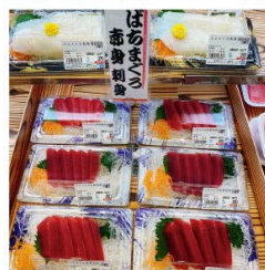
まぐろは力を入れています。