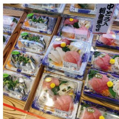
いろいろなお刺身盛り合わせを販売