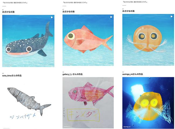
インスタ「海好き Kids コラボ」