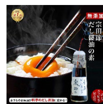
だしが良くでる宗田節

https://item.rakuten.co.jp/tosasakuraya/yoshinaga_utsubo/?variantId=yoshinaga_utsubo