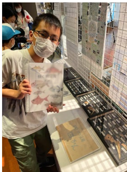
海と日本プロジェクト「全国子ども熱源サミット」 関東ブロック代表