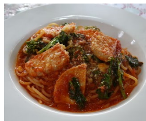
外食店でのフェア開催