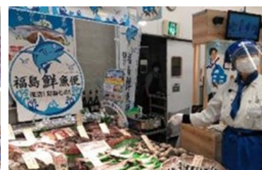
量販店での販売の取組