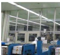
空気を經由した汚染の防止設備 (パーティション) の導入