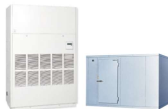
温度管理を要する装置・設備の導入