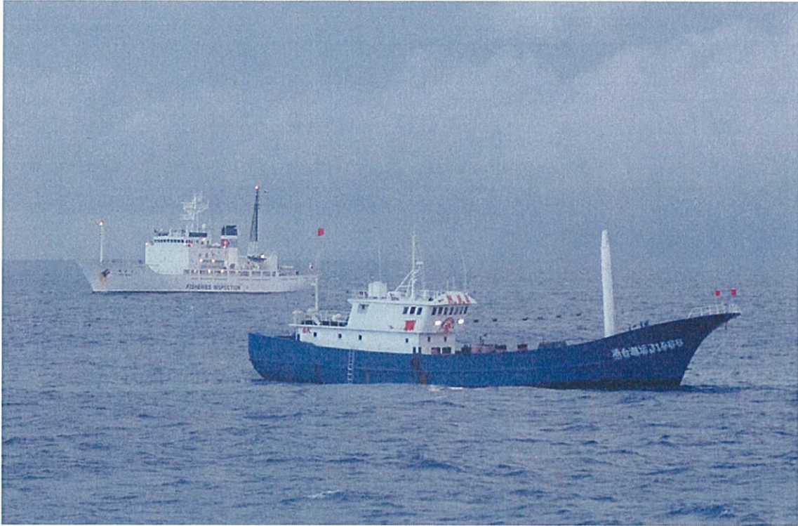
浙台漁運31488(手前)と、水産庁漁業取締船東光丸(奥)