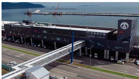
石巻市水産物地方卸売市場