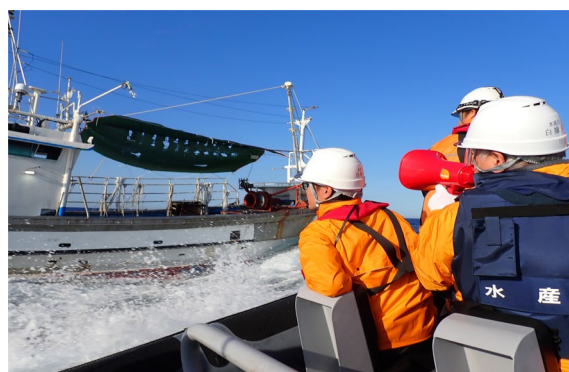
山陰沖において立入検査のため漁業 監督官が韓国漁船に呼びかける様子