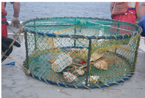
山陰沖において外国漁船が違法に 設置したとみられる漁具の押収 (ばいかご)