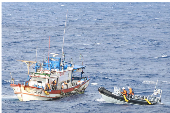
沖縄県与那国島付近において 拿捕のため台湾漁船に移乗する漁業監督官