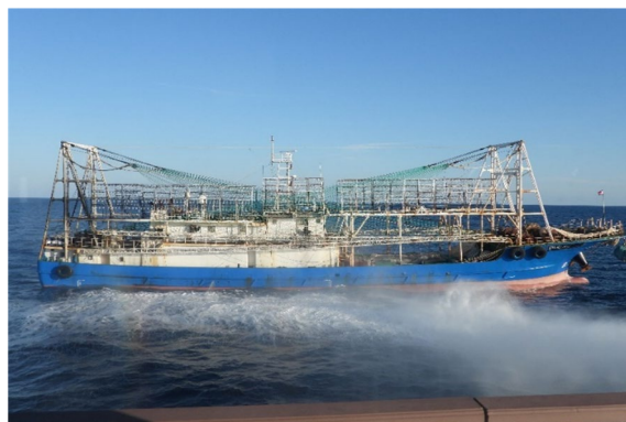
違法操業を行う中国漁船に対し 放水措置を行う様子