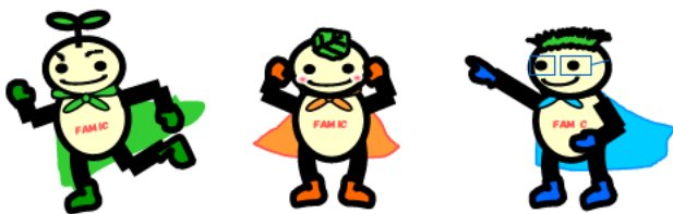
FAMIC イメージキャラクター