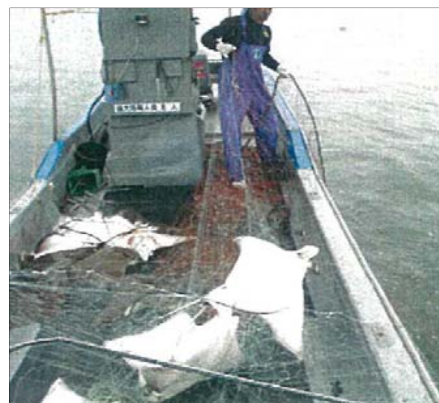
刺し網にかかったナルトビエイ