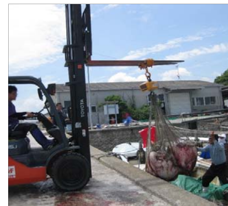
駆除したナルトビエイの陸揚げ