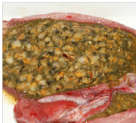
胃内容物(大量の二枚貝)