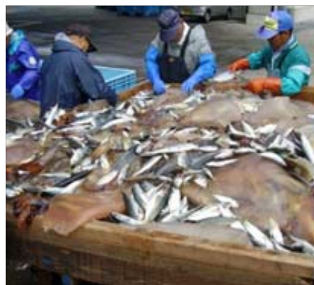
商品にならない漁獲物の選別