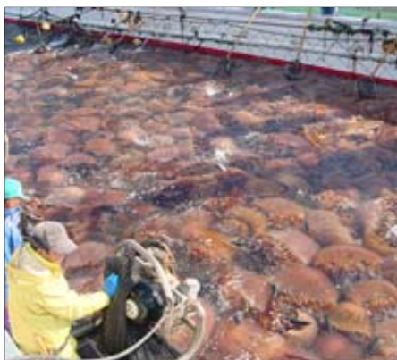
定置網への大量入網