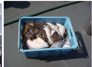
押収漁獲物(主にカレイ類)