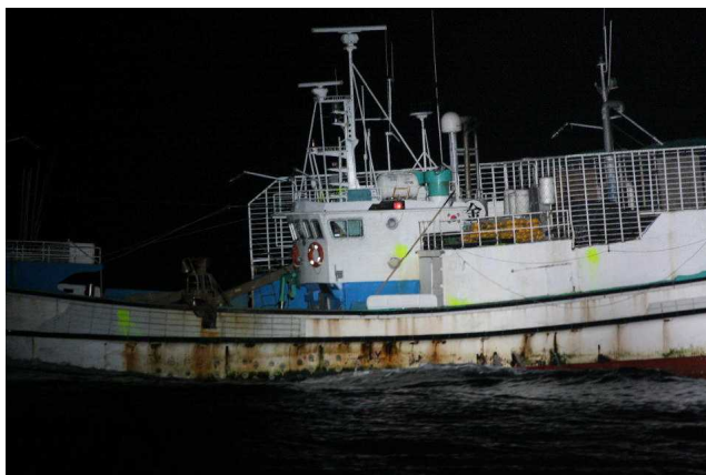
立入検査を拒否して逃走する韓国あなご筒漁船、左舷側外板の黄色は着色弾が命中した跡(平成21年5月20日) 外交ルートを通じて抗議したところ、韓国政府により韓国国内で処分された

こうした案件については、外交ルートを通じて旗国政府に抗議を行う一方、我が国EEZ操業許可船の場合には許可取消等の行政処分を行うなど、引き続き粘り強く取り組んでいく。