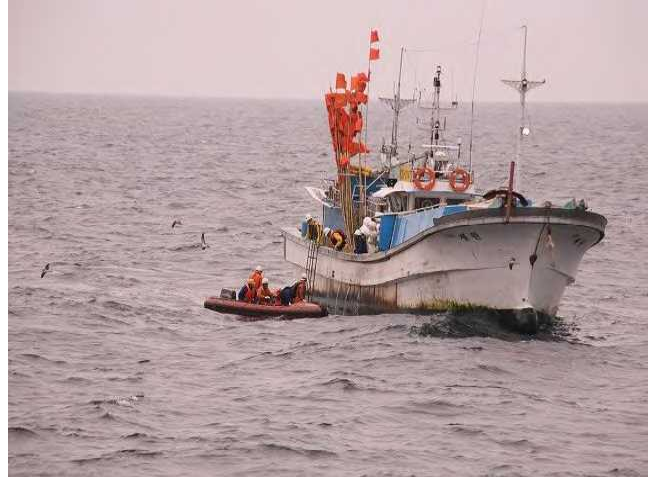
立入検査のため韓国はえ縄漁船に乗り込む漁業監督官 (平成21年4月3日、操業日誌不実記載により現行犯逮捕)

我が国排他的経済水域(EEZ)において操業する外国漁船の拿捕件数は、平成14年をピークとして、以降は減少傾向にあったが、平成19年以降増加に転じ平成20年は18件となったが、平成21年は13件となった。