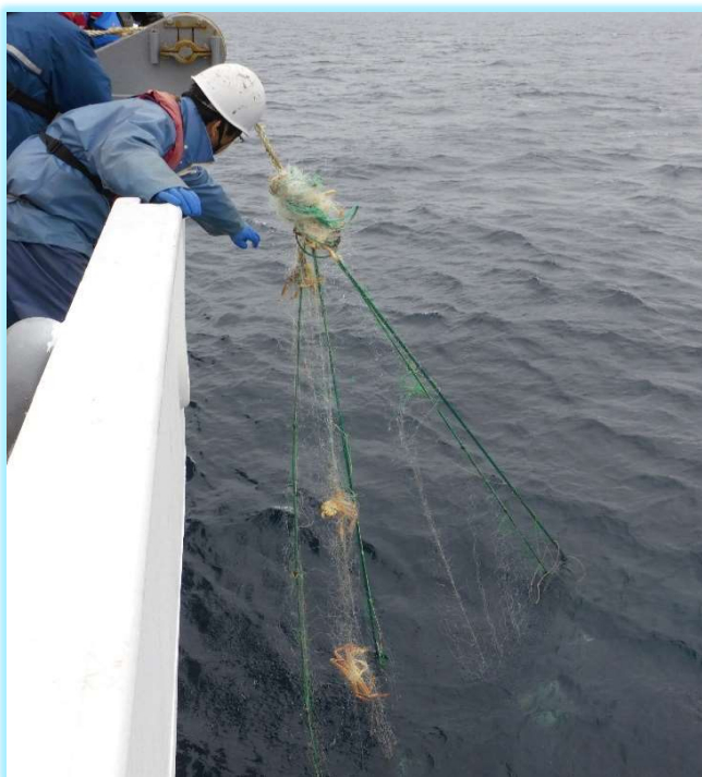
刺し網漁具の押収作業