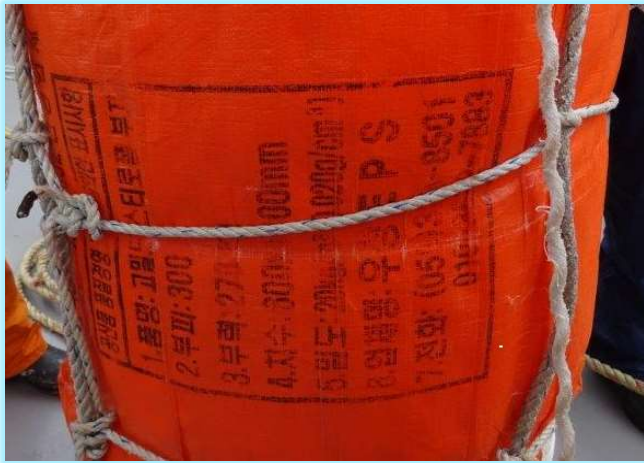
海中から引き揚げられたハングル文字入りの浮標