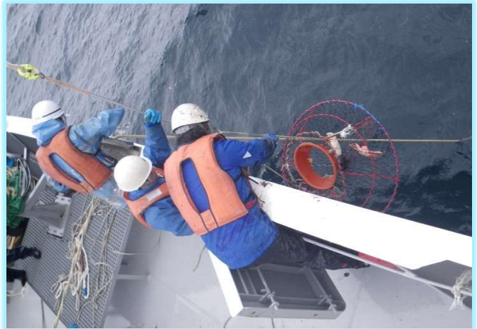
かにかご漁具の押収作業