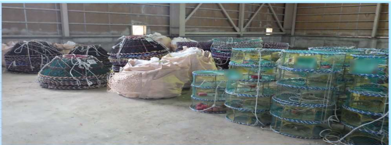
押収漁具の保管状況