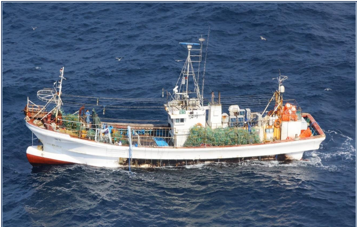
ばいかご漁船(韓国)