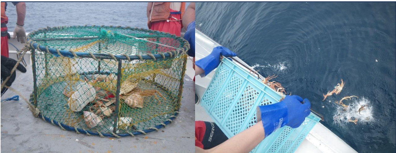
押収した漁具の中にいたズワイガニ及びバイガイ