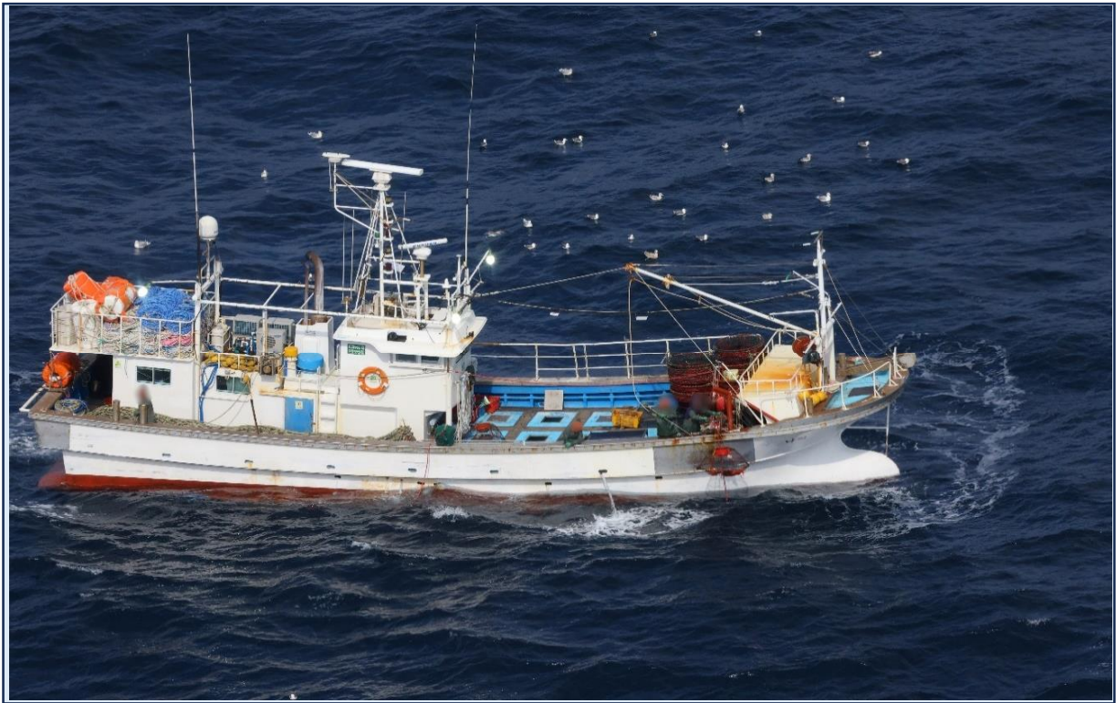
かにかご漁船(韓国)