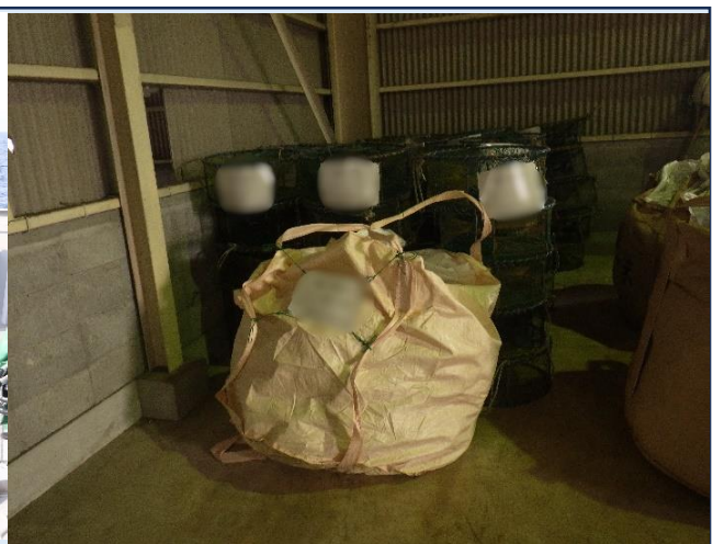
保管している押収漁具