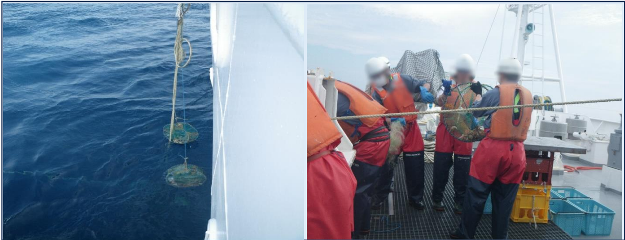
ばいかご漁具を押収している様子